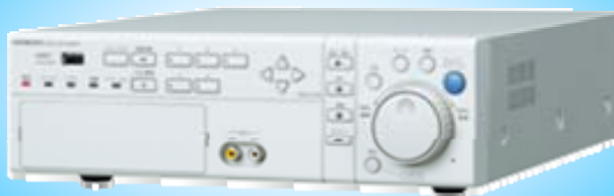
小型5CHレコーダー など