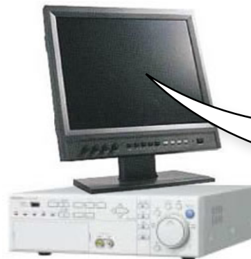
デジタルレコーダ/5CH